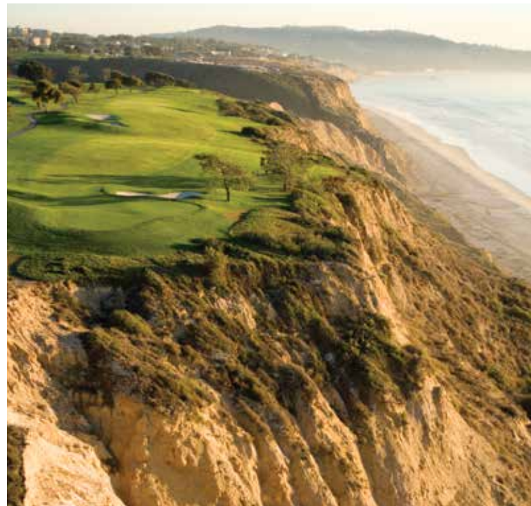
Torrey Pines Golf Course