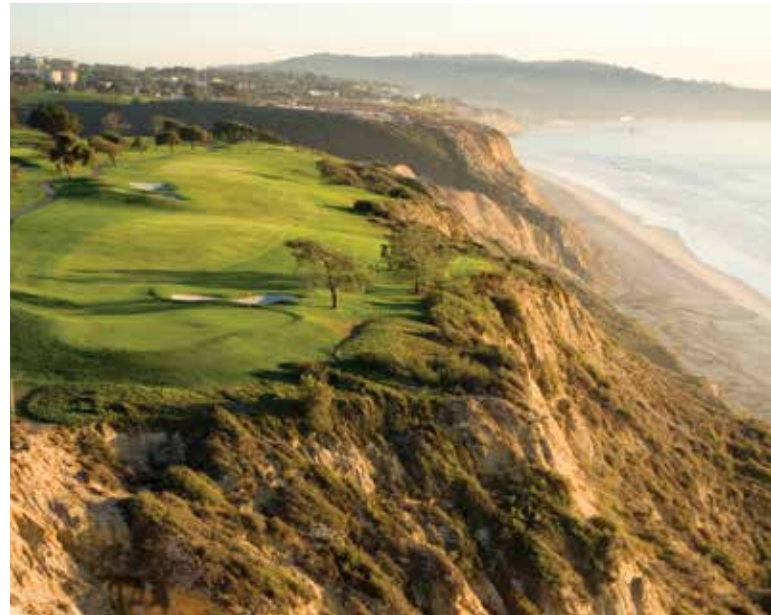
Torrey Pines Golf Course

San Diego goza de la singular oportunidad de poder ofrecer unas vacaciones de dos naciones gracias a la conveniencia de tener a la vibrante ciudad de Tijuana a una distancia de tan solo 24 kilómetros del centro de la ciudad. CBX es un puente peatonal sobre la frontera entre México y Estados Unidos, que conecta el Aeropuerto Internacional General Abelardo L. Rodríguez en Tijuana y un nuevo edificio en San Diego exclusivamente para pasajeros del Aeropuerto de Tijuana que cruzan la frontera como parte de su viaje. Más hacia el sur se encuentra el valle de Guadalupe, hogar de la ruta del vino mexicano.