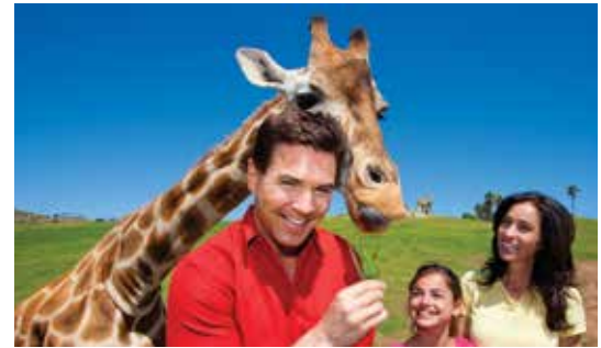
San Diego Zoo Safari Park