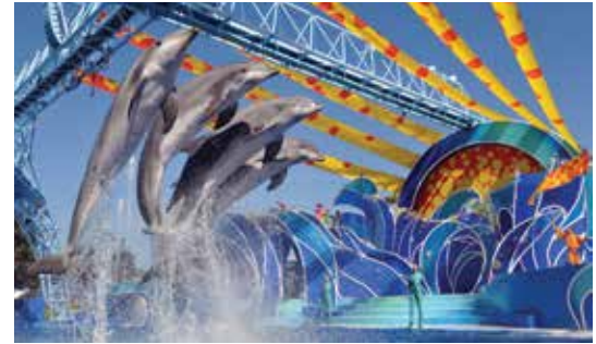
Sea World San Diego