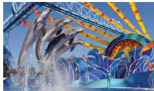
Sea World San Diego