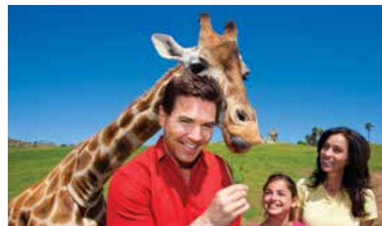
San Diego Zoo Safari Park