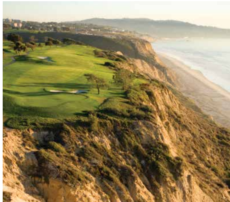
Torrey Pines Golf Course