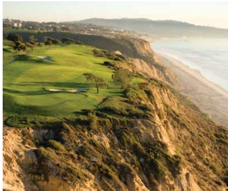
Torrey Pines Golf Course