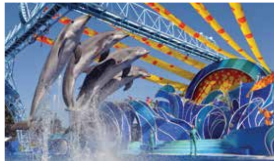
Sea World San Diego